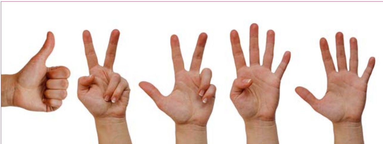
Het aantal leden van een omroepvereniging vormt de basis voor een (voorlopige) erkenning

samenwerking met de andere landelijke omroepinstellingen. Het Commissariaat stuurt de aanvragen met de opgaven van de aantallen leden, de beleidsplannen en eventuele opmerkingen daarover door naar de Minister die de (voorlopige) erkenningen uiteindelijk verleent.