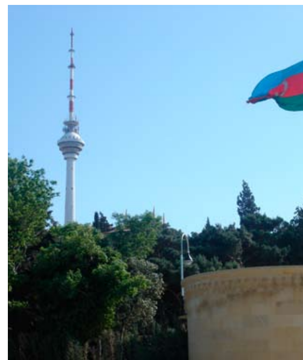
De televisietoren van Bakoe.