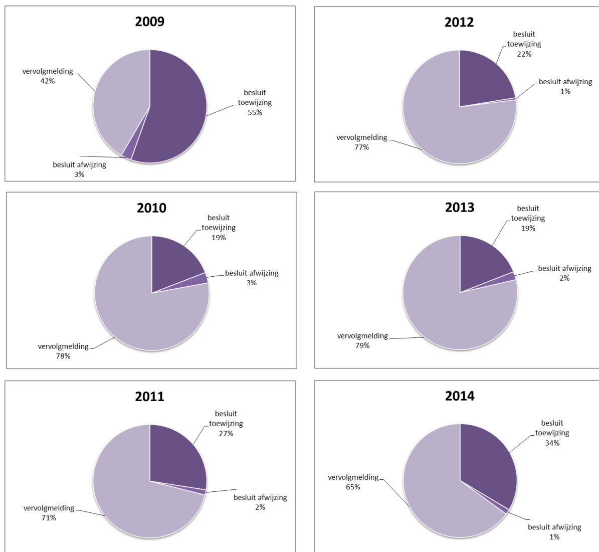
Figuur 6: Intensiteit van toetsing